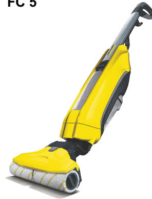
HARTBODENREINIGER FC 5