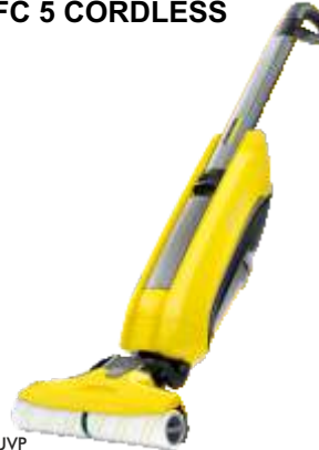
HARTBODENREINIGER FC 5 CORDLESS