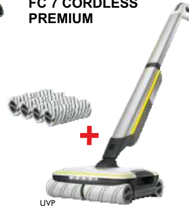
HARTBODENREINIGER FC 7 CORDLESS PREMIUM