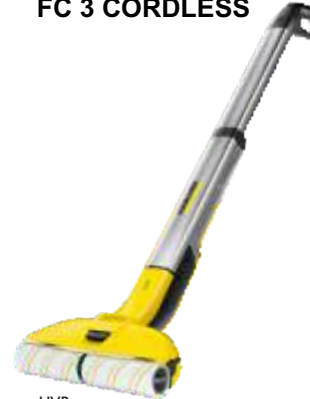
HARTBODENREINIGER FC 3 CORDLESS